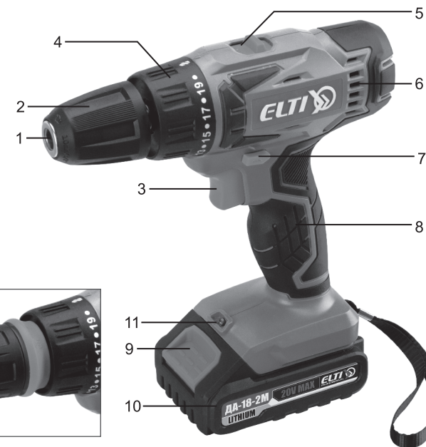
Съёмный патрон модели ДА-18-2МС